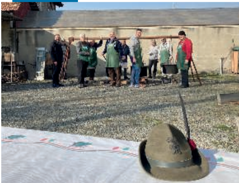
LA FAGIOLATA CON GLI ALPINI Grande giornata quella di sabato scorso, 11 febbraio, per il Gruppo Alpini di Vigliano con un'ottima partecipazione alla tradizionale fagiolata. Durante la giornata sono state distribuite circa 300 porzioni.