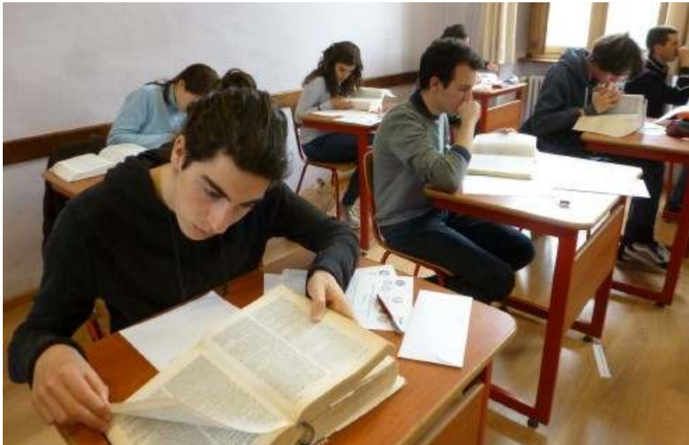
In alto, i ragazzi al lavoro durante la gara di traduzione dell'Agòn di Greco Biblico