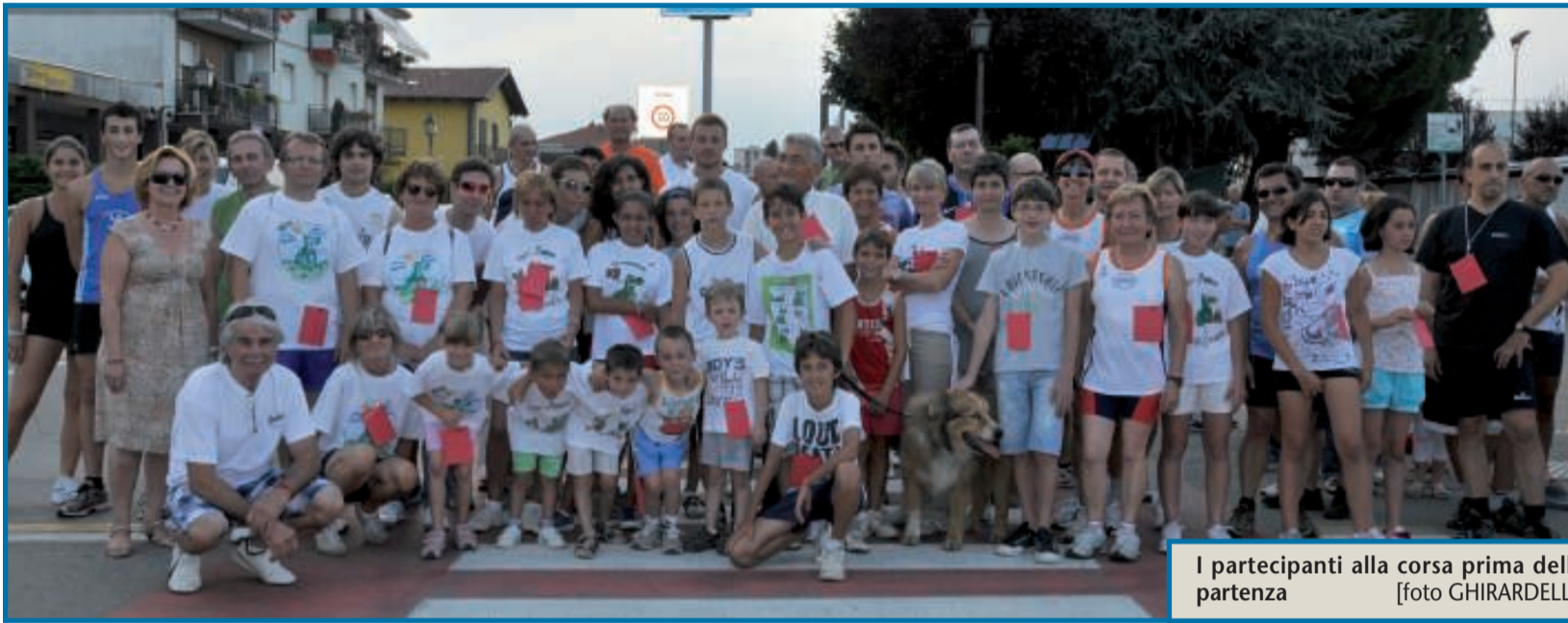
I partecipanti alla corsa prima della partenza

Erano 124 gli iscritti alla gara non competitiva organizzata a favore della Lega Tumori di Biella. Consegnato un assegno di 1.031 euro