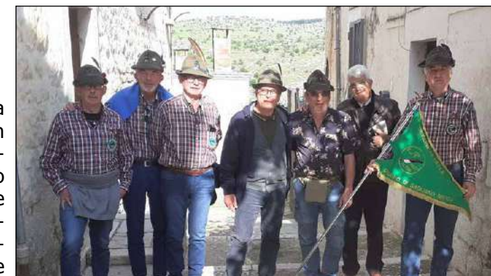
Al centro della foto il sottotenente minervinese che si è unito a noi.

me, scortati da sei alpini con la camicia sezionale. Dopo la funzione religiosa siamo stati ospiti, nella sede della Pro Loco, per il pranzo. Durante il convivio abbiamo donato alla signora Sindaco la targa del Gruppo. Il suo successivo desiderio di poter posare per una fotografia con noi alpini è stato prontamente esaudito: tutti schierati con lei al centro. Verso la fine del pranzo è entrato in sala un alpino minervinese con "cappello da sottotenente". Saputo della nostra presenza, ha fatto di tutto per trovarci e unirsi alla grande famiglia alpi-