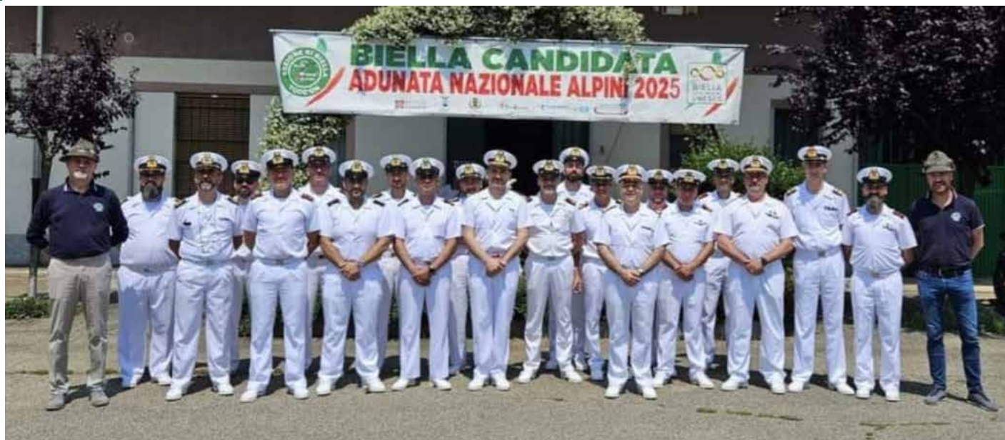
Gli Alpini danno il benvenuto alla fanfara del Comando interregionale marittimo nord – La Spezia Marina Militare Italiana, presente a Biella.