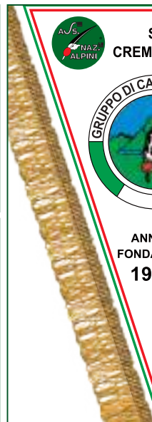
MODELLO 6 23×28,5 cm.