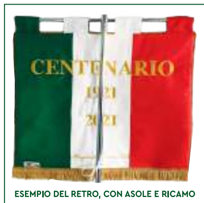
ESEMPIO DEL RETRO, CON ASOLE E RICAMO

LA PRESENZA DELL'OLOGRAMMA CERTIFICA L'UFFICIALITÀ DEL VESSILLO