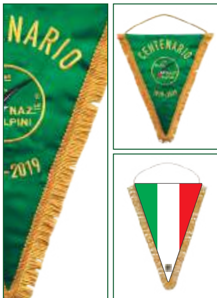
MODELLO 1 - 32x39 cm.