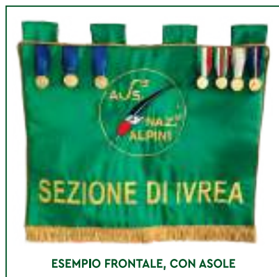
ESEMPIO FRONTALE, CON ASOLE