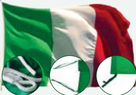
CAPPIO PER CARRUCOLA